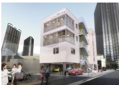
▲物件外観イメージ