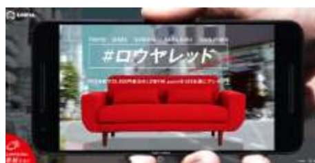
キャンペーンサイトイメージ