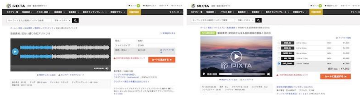
▲2017 年 10 月から新たに販売を開始した音楽素材(左)。動画素材(右)との親和性も高く制作ニーズに応えています。

また、昨今の AI(人工知能)開発の活発化に伴い、画像解析研究を目的に PIXTA の画像素材を利用するという新たな需要も誕生。さらに、2017 年 10 月には新たに音楽素材の販売を開始して素材の種類も広げ、動画素材と合わせて購入者の制作ニーズに応え、新たな需要を取り込んでいます。