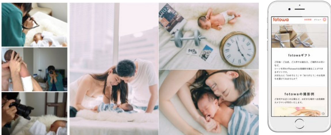
▲撮影の様子(左縦3点)と実際の新生児撮影例(右3点)

ピクスタ株式会社(東京都渋谷区 代表取締役社長:古俣大介、東証マザーズ:3416)が運営する、写真を見て好みの作風のフォトグラファーに出張撮影を依頼できるサービス「fotowa(フォトワ)」( https://fotowa.com/ )から、出張撮影をプレゼントできる「fotowa ギフト券」が誕生。2017年6月1日から販売を開始します。