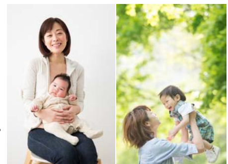
どちらの写真撮って欲しいと思いますか？

*2) インターネットによるアンケート調査「Google Consumer Surveys」 期間: 2016年1月29日~1月31日 回答者数: 1136名