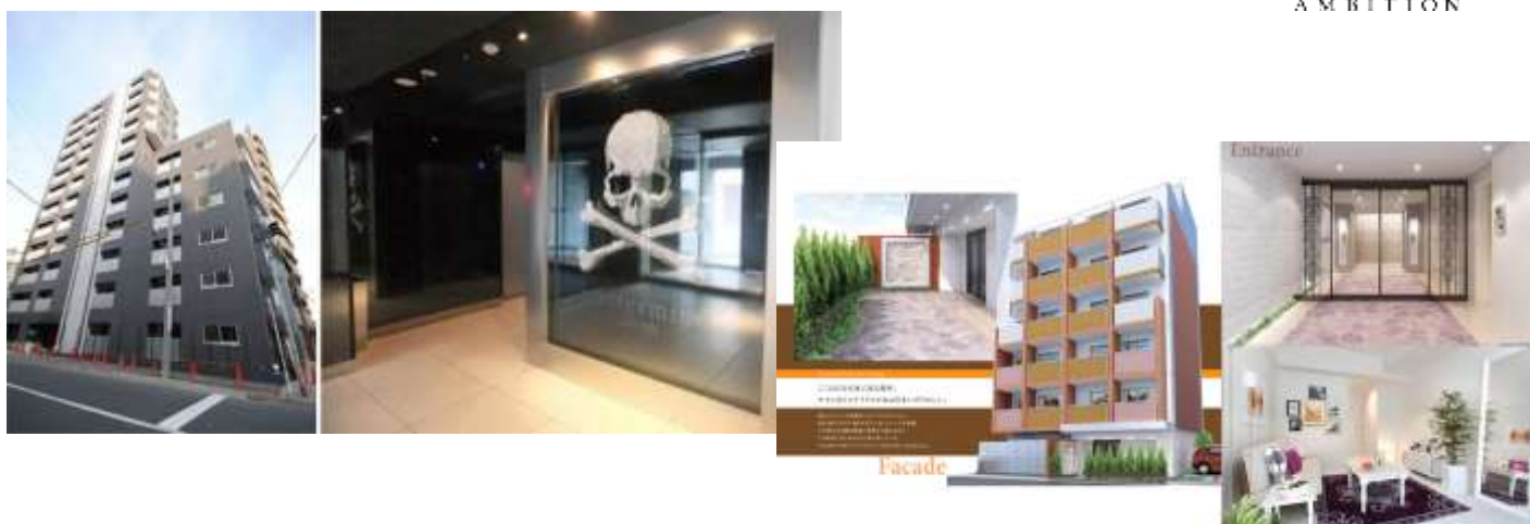
※上記写真は、ヴェリタスの開発実績のある物件です。