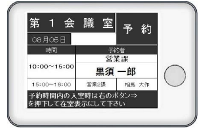
電子ペーパー式の部屋パネル

これまでの会議室予約システムは、部屋パネルがタブレット端末方式であることが多く、カラーで目立つ代わりに、多機能で操作が煩雑となり、とても高額となるケースが多く見られました。OSの不具合や機器の盗難リスクに対応するためのバージョンアップやセキュリティ対策に加え、電源工事なども必要で、導入・運用にお金と時間と労力を要しました。