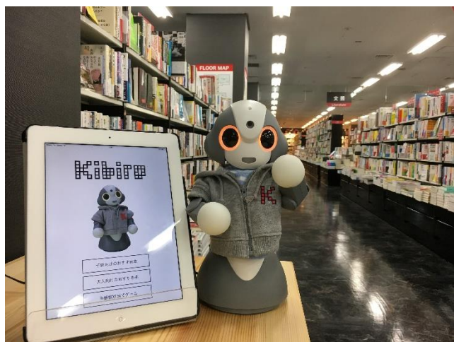
※イベント当日の実際の売場は若干異なります