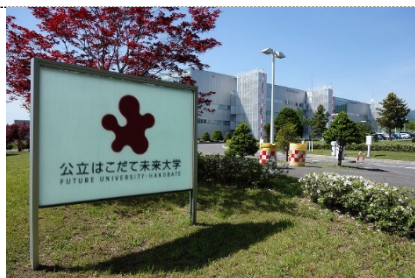
人工知能学会第29回全国大会会場 公立はこだて未来大学

2003年の創業時、当社はディスクバリ対策支援企業として膨大な電子データを高速かつ正確に解析して顧客の利益（知的財産、人的リソース等）を守ることを使命としていました。訴訟や不正調査に関する実績を重ねる中、当社の証拠発見技術を人工知能として実用化し、さらなる改良のために高度情報解析課ならびに行動情報科学研究所を設立しました。近年は当社の人工知能の特徴である「少ないデータから専門家の暗黙知を学び、大量データを高速に仕分けする技術（Predictive Coding、プレディクティブ・コーディング）」が他の事業分野にも応用可能であることから、新規事業の開拓に注力しています。今回の展示では、こうした実ビジネスでの当社の人工知能技術の活用例を中心にご紹介しました。